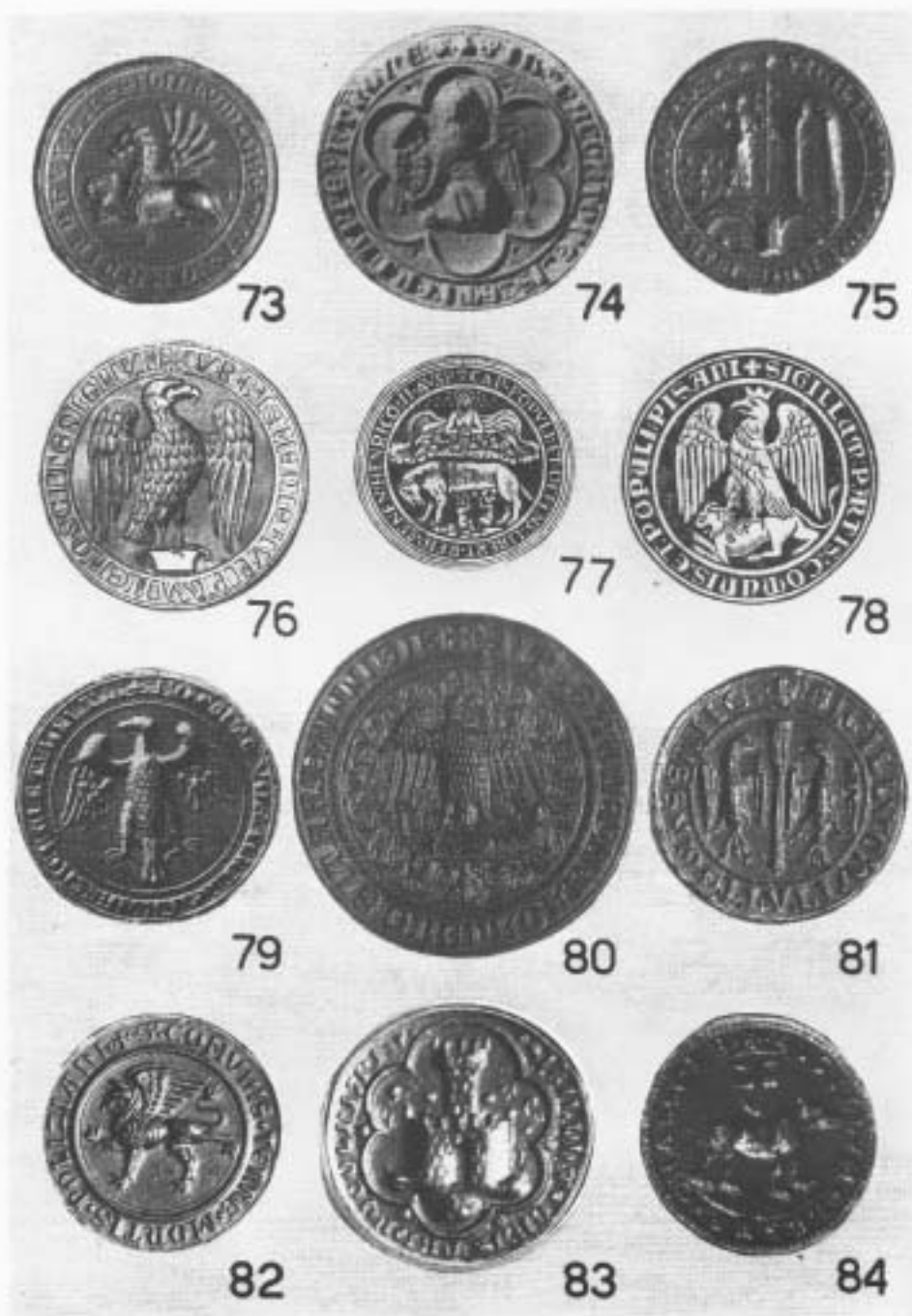
Tavola VII. 73. Camportondo. 74. Cortona. 75. Pontorno. 76. Pisa. 77. Siena. 78. Comune e popolo di Pisa. 79. Todi. 80. Parte Guelfa di Firenze. 81. « S. Civitatis Massane ». 82. Montepulciano. 83. Castel Focognano. 84. Lega di Cascia.