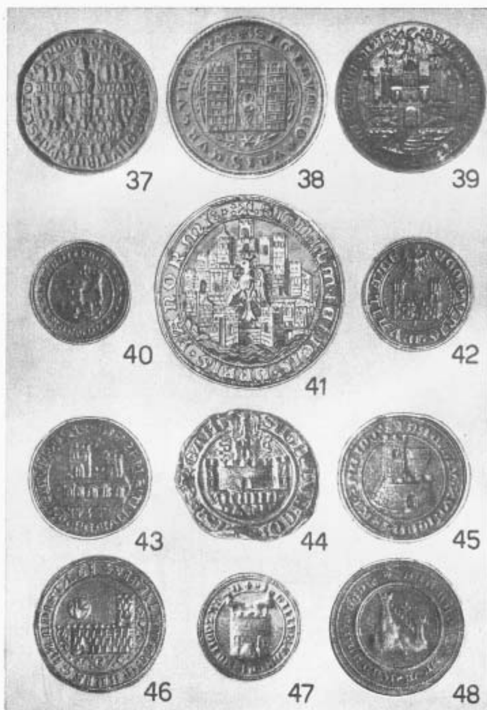
Tavola IV. 37. Garfagnana. 38. Curzola. 39. Foligno. 40. Marradi. 41. Palermo. 42. Val- late. 43. Rocca di Massa. 44. Bergamo. 45. Castiglioni d'Ombrone. 46. Guardistallo. 47. Menzano. 48. Castel dell'Alpe.