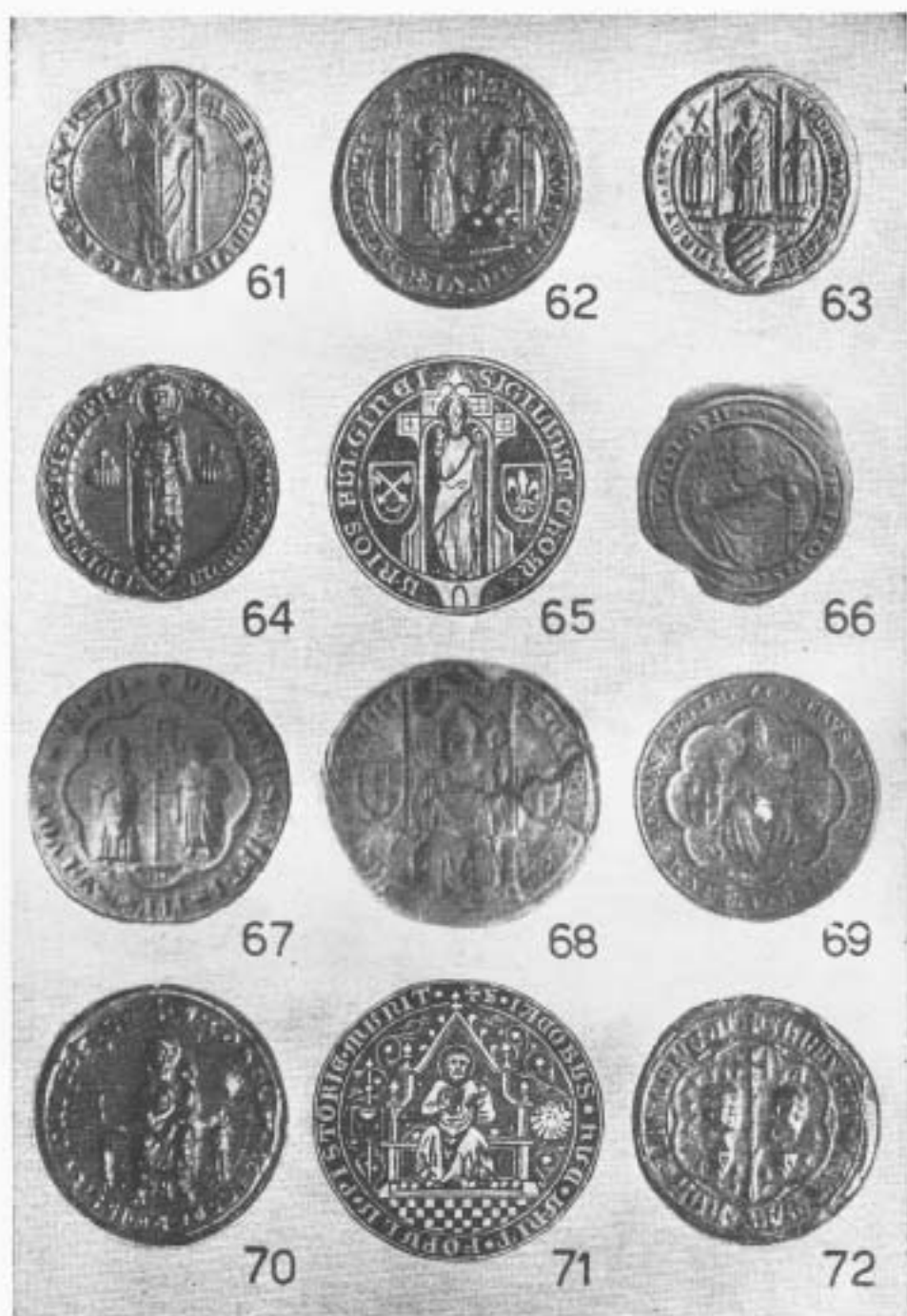
Tavola VI. 61. Cherso. 62. Isola Martana. 63. San Giusto. 64 e 71. Pistoia. 65. Foligno. 66 e 68. Milano. 67. Reggio. 69. Bologna. 70. Consoli del popolo di Cortona. 72. Urbani (Castel Durante).