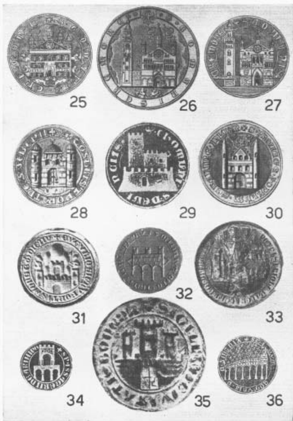
Tavola III. 25, 26, 27. Cremona. 28 e 30. San Severino (Marche). 29. Vinci. 31. Gubbio. 32. Bologna: Ufficio delle strade, dei porti, delle acque. 33. Comune di Bologna (1338). 34. « Sigillum Passagerii de Arimino ». 35. Comune di Bologna (1264). 36. Comune di Signa.