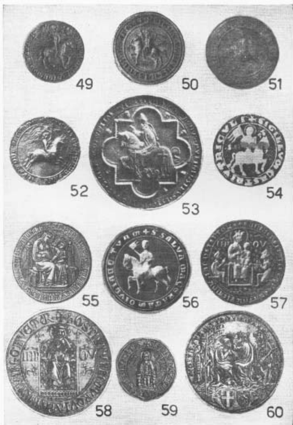
Tavola V. 49. Avellano. 50. Bassanello. 51. Marcialla di Val d'Elsa. 52. Asti. 53. Modena. 54. Otricoli. 55 e 59. Pisa. 56. Macerata. 57. Comunità dei Pisani prigionieri a Genova. 58 e 60. Parma.