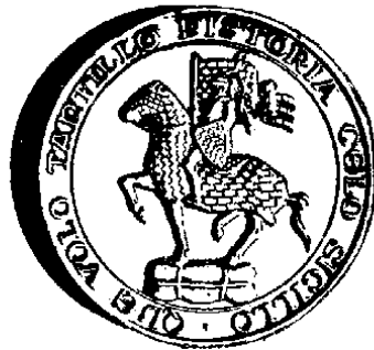
Sigillo di Pistoia col cavaliere.

Vi furono Comuni che assunsero come emblema sigillare un santo a cavallo, talvolta con armatura, col gonfalone e con altri attributi; è probabile che anche tale tipo abbia simboleggiato il predominio signorile, ma non ne abbiamo la certezza, perciò ne tratteremo in altro paragrafo (figure 4-9).