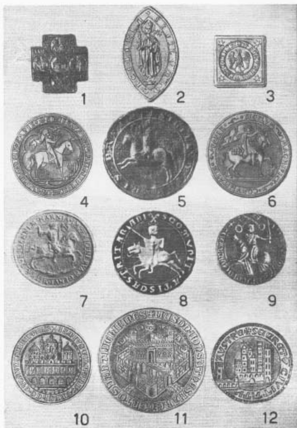
Tavola I. 1. Castel di Piscina. 2. Cologno Monzese. 3. Concordia. 4, 5, 6. Pavia. 7. Narni. 8. Castel Tarano. 9. Magliano. 10. Verona. 11. Padova. 12. Cividale. (Non tutti i sigilli sono riprodotti in grandezza naturale).