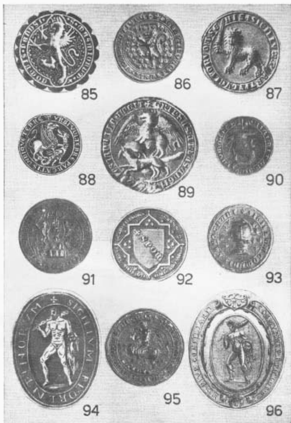
Tavola VIII. 85. Massari di Perugia. 86. Lega di Montevarchi. 87. Guelfi di Siena. 88. Volterra. 89. Genova. 90. Artimino Valdarno. 91. Montsummano. 92. Conservatori della Camera di Roma. 93. Capognano. 94. Comune di Firenze. 95. Ghibellini di Firenze. 96. Firenze sotto i Medici.